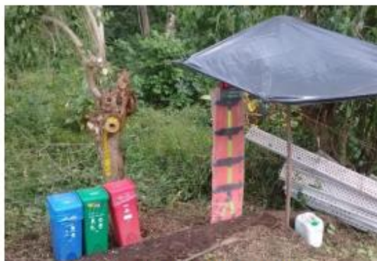
Fotografía 5 Carpa temporal