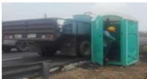
Fotografía 3 Mantenimiento baño portátil