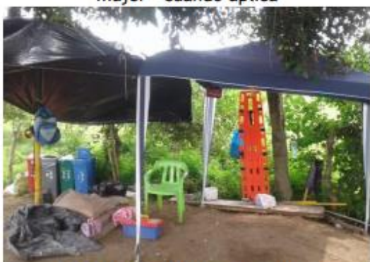
Fotografía 4 Carpa temporal