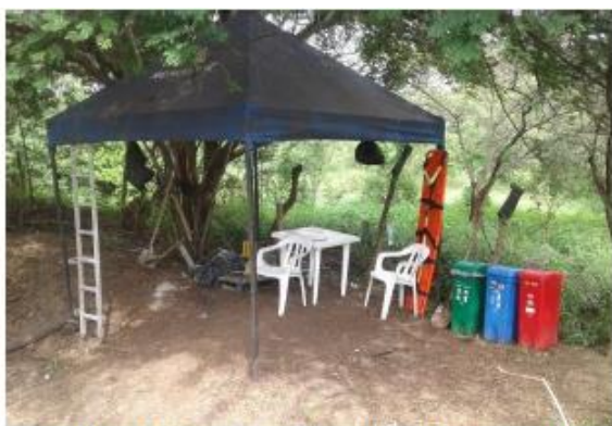
Fotografía 5 Carpa temporal con punto ecológico, botiquín, camilla, extintor y kit antiderrame