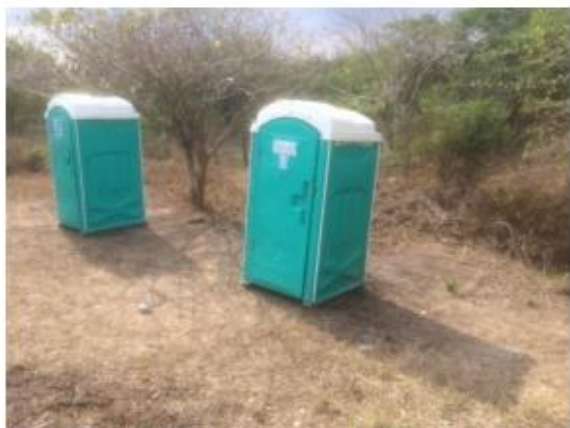
Fotografía 2 Baño portátil para hombre y mujer - cuando aplica

“POR MEDIO DE LA CUAL SE DECLARAN CUMPLIDAS LAS OBLIGACIONES IMPUESTAS MEDIANTE LA RESOLUCIÓN No.00674 DE 21 DE SEPTIEMBRE DE 2018 PRORROGADA POR LA RESOLUCIÓN 00265 DE 10 DE ABRIL DE 2019 Y EL AUTO No.001418 DE 8 DE AGOSTO DE 2019, RELACIONADAS CON EL PERMISO DE OCUPACION DE CAUCE OTORGADO A FAVOR DE LA SOCIEDAD CONCESIONARIA VIAL MONTES DE MARIA S.A.S., IDENTIFICADA CON NIT: 900.858.096- 4., Y SE DICTAN OTRAS DISPOSICIONES”.