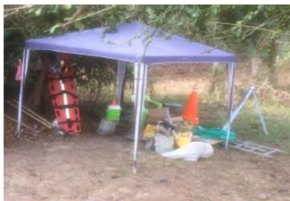
Fotografía 6 Carpa temporal con punto ecológico, botiquín, camilla, extintor y kit antiderrame

Posteriormente se describe cada una de las actividades realizadas en cada Pontón, (Documento anexo 73 Paginas), se resumen a continuación: